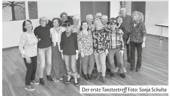
Der erste Tanzteeteeff