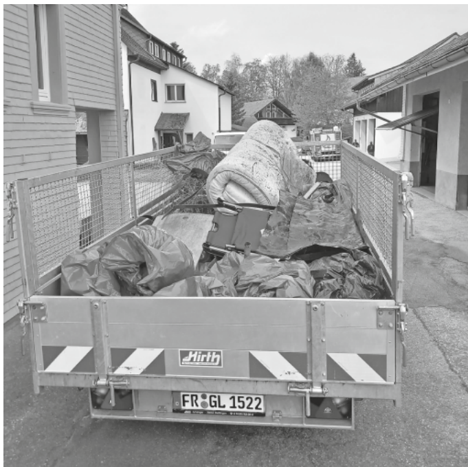
Sammelergbnis Ortsputzete Kappel