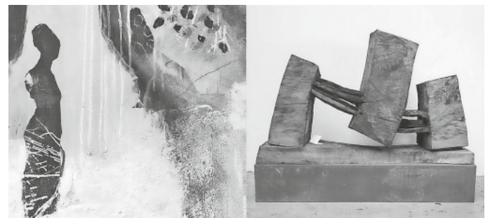
MENSCHSEIN – FRAGIL UND STABIL

Öffnungszeiten: täglich von 9:00 - 18:00 Uhr Feldbergkirche / Eberlinweg 2 / 79868 Feldberg