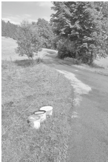
Entsorgt am Fahrbahnrand

Roland Berr, Ortsvorsteher Kappel 07653-902061