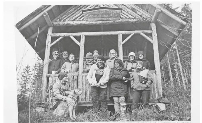
Schwarzwaldverein e.V. - Lenzkirch

Im Rahmen dieser Ausstellung wird der Kalender zum Preis von 15 Euro zum Kauf angeboten, davon werden 8 Euro als Spende dem Bundesverband-Kinderhospiz e.V. Lenzkirch zukommen.