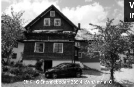
Eff.Kl. G Energiebedarf 239,4 kWh/(m 2 ·a) Öl

Immobilien- & Sachverständigen-Büro Kirchgasse 3 D-79868 Feldberg Telefon: 07655-1521 www.dahoim-immobilien.de