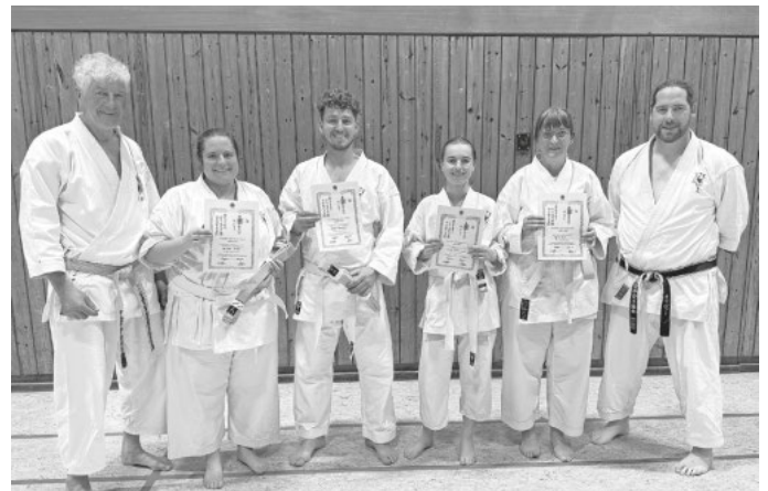
Die erfolgreichen Prüflinge mit Ihren Trainern