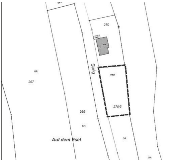
Geltungsbereich der 2. Bebauungsplanänderung mit örtlichen Bauvorschriften „Steig“ (ohne Maßstab)

Die Abgrenzung des Geltungsbereichs umfasst Teile des Flurstücks Nr. 270/5 im Gewann „Auf dem Esel“ und hat eine Flächengröße von 675m 2 .