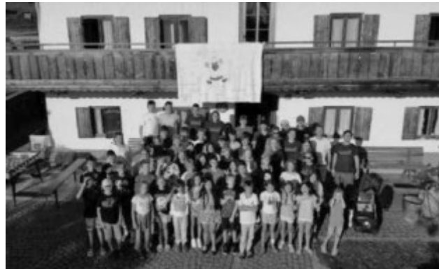
(Gruppenbild der Ministranten-Freizeit 2024 in Frasdorf am Chiemsee)