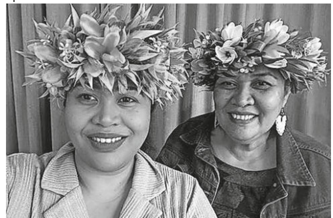
Wir laden ein zu unseren Weltgebetstagsgottesdiensten

Petruskirche Schluchsee, Sa, 22.3. um 16.30. Es singen die „Schwarzwälder Gospelsingers“ aus Neustadt! Eintritt frei, Spenden willkommen