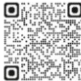
QR Code

Haben Sie Interesse, ehrenamtlich bei uns tätig zu werden? Gerne informieren wir Sie im persönlichen Gespräch über die Möglichkeiten der Mitarbeit.